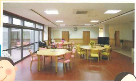
④1F/食堂・機能訓練室